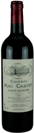
Château Mac Carthy, 2016

Un Saint-Estèphe d'excellence au plaisir immédiat !